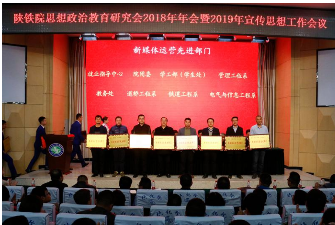
学院每年对网络思政育人先进单位和个人进行表彰