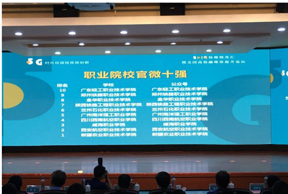
学院新媒体建设成效明显，两次荣获全国职业院校官微十强称号