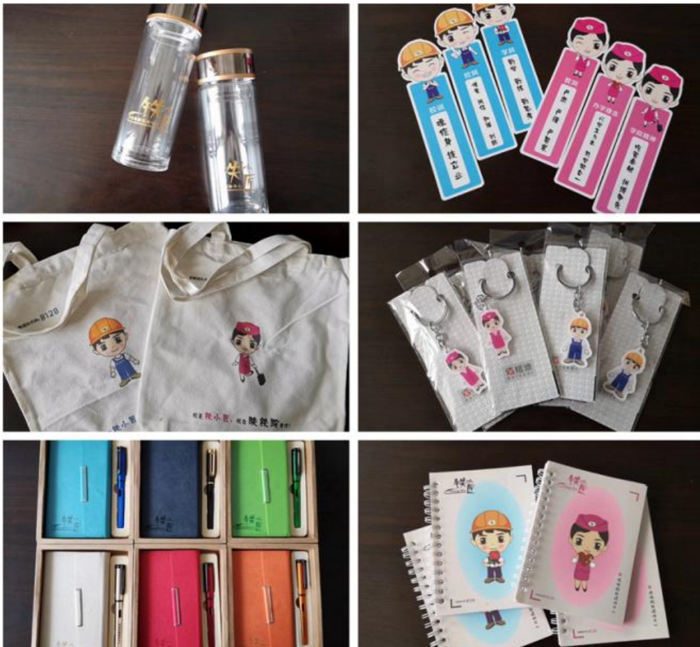
学院着力打造铁小匠网络思政文化品牌，引领广大学子争做铁路工匠人才