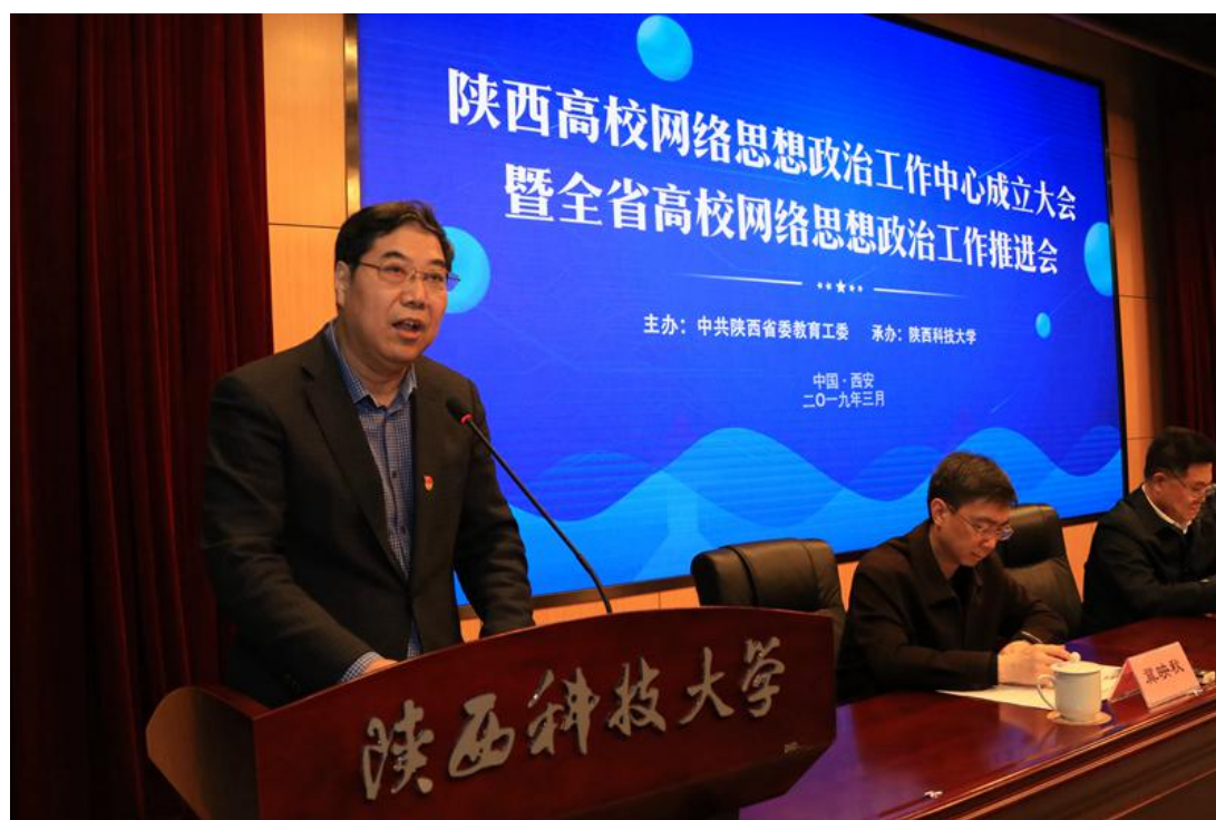
学院在陕西高校网络思政工作推进会上做经验分享交流