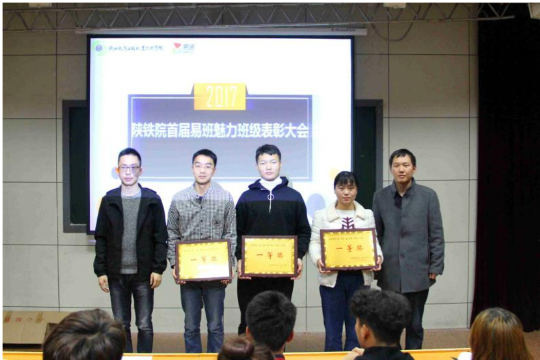
学院依托易班平台强化网络思政育人工作