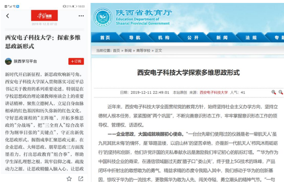
图 4 媒体报道截图

阅读者学习并受教，创作者思考并提升，漫画微党课网络思政作品探索了“思政贯通、师生联动、主客互动”网络育人新模式，学生的正向反馈是网络新形势下对新媒体翻转思政创新最大“点赞”和最好成效。