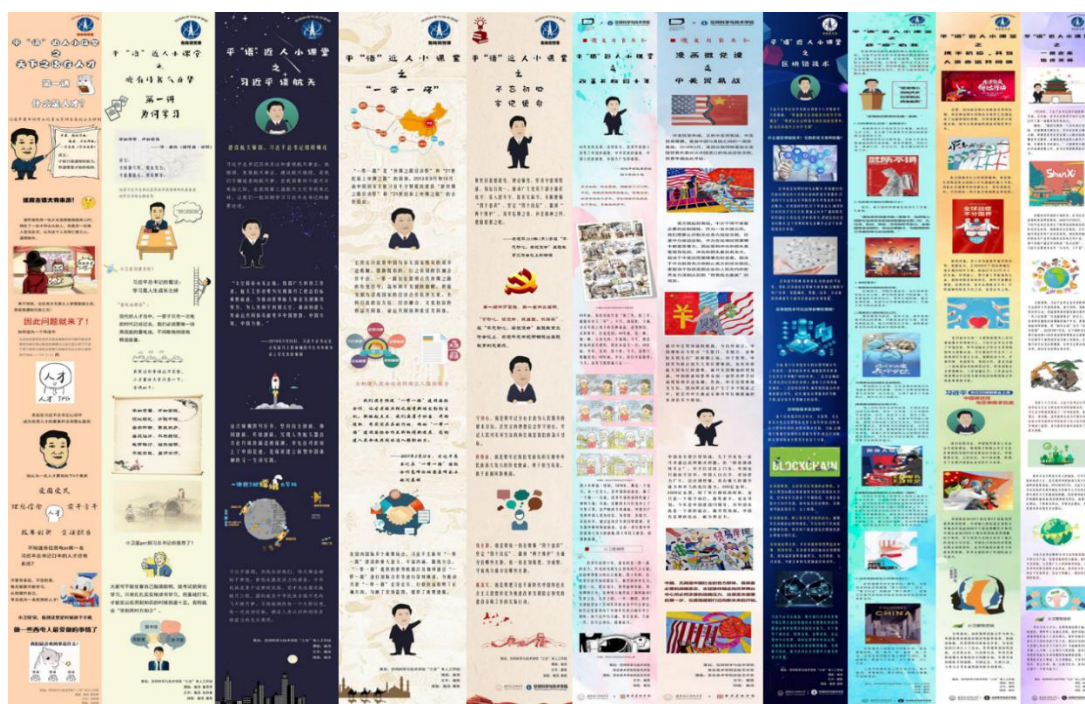
图3 《平“语”近人小课堂》漫画微党课部分作品

在学院“三全育人”工作领导小组的指导下，学院新闻中心网络思政育人工作组学生牵头，各学生班团组织广泛参与下，漫画微党课策划组以《平“语”近人——习近平总书记用典》为蓝本素材，结合习近平总书记在全国教育大会讲话精神，推出《时代向心力——平“语”近人小课堂》漫画微党课系列，内容涵盖乡村振兴、中华优秀传统文化、中美贸易战、人类命运共同体、五四精神、新中国成立70周年、区块链、疫情防控等多个热点主题。